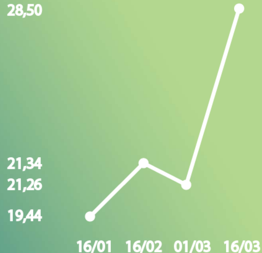
Histórico de Cotações – BOVESPA